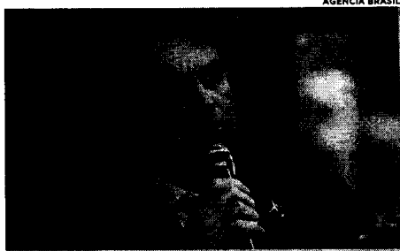
O presidente Jair Bolsonaro concede reajuste de 33,24% no piso dos professores da educação básica

O presidente Jair Bolsonaro anunciou no Twitter nessa quinta-feira (27) reajuste de 33,24% no piso dos professores da educação básica. A disposição de conceder a reposição foi antecipada pelo chefe do Executivo na última quarta-feira, a apoiadores em frente ao Palácio da Alvorada. Hoje, o piso nacional da categoria é de R$ 2.886,24. Com o reajuste, irá para R$ 3.845,62. "Esse é o maior aumento já concedido, pelo governo federal, desde o surgimento da Lei do Piso (de 2008). Mais de 1,7 milhão de professores, dos Estados e municípios, que lecionam para mais de 38 milhões de alunos nas escolas públicas serão beneficiados", publicou o presidente na rede social. O Brasil tem cerca de 1,7 milhão de docentes no ensino básico. Pela Lei do Magistério, o reajuste de professores é atrelado ao chamado