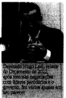
Deputado Hugo Leal, relator do Orçamento de 2022, após intensas negociações com líderes partidários e o governo, fez vários ajustes em seu parecer.

Na segunda-feira (20), o relator divulgou seu parecer sem essa previsão. O presidente da República Jair Bolsonaro ligou para Hugo e pediu para rever sua decisão. Os recursos serão transferidos de outras pastas do Executivo, incluindo o Ministério da Economia. Na semana passada,