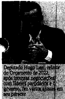
Deputado Hugo Leal, relator do Orçamento de 2022, após intensas negociações com líderes partidários e o governo, fez vários ajustes em seu parecer

O relator do Orçamento também prevê corte de R$ 1,2 bilhão da administração de unidades federais, do fundo eleitoral e no valor destinado a emendas parlamentares, que não são impositivas. Os novos recursos serão incorporados para a Saúde e para a Educação.