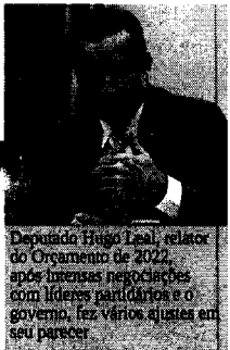
Deputado Hugo Leal, relator do Orçamento de 2022, após reuniões com líderes partidários e o governo, fez vários ajustes em seu parecer.

Na segunda-feira (20), o relator divulgou seu parecer sem essa previsão. O presidente da República Jair Bolsonaro ligou para Hugo e pediu para rever sua decisão. Os recursos serão transferidos de outras pastas do Executivo, incluindo o Ministério da Economia. Na semana passada,