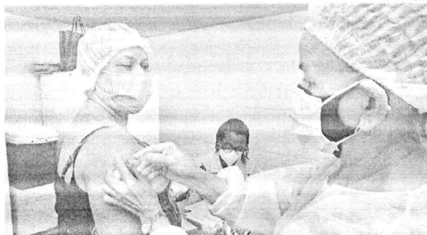
Primeiro dia da terceira fase da vacinação contra a H1N1 foi marcado pela grande procura pelos postos de saúde da Prefeitura de São Luis