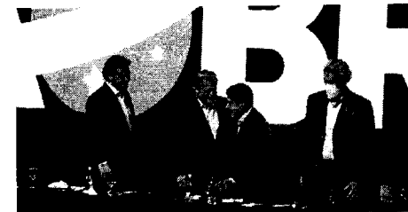
Os presidentes do PSL, Luciano Bivar, e do DEM, ACM Neto, selaram a fusão dos seus partidos em outubro em convenção simultânea.

ganhar com a fusão do DEM e do PSL, uma movimentação de muito significado, tanto agora quanto adiante, inclusive com perspectivas de atração de gente de outros partidos, que aponta resultados positivos e impactos benéficos na política maranhense.