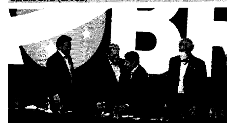
Os presidentes do PSL, Luciano Bivar, e do DEM, ACM Neto, selaram a fusão dos seus partidos em outubro em convenção simultânea.

ganhar com a fusão do DEM e do PSL, uma movimentação de muito significado, tanto agora quanto adiante, inclusive com perspectivas de atração de gente de outros partidos, que aponta resultados positivos e impactos benéficos na política maranhense.