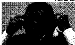
Ministro da Saúde, Eduardo Pazuello, disse que o governo brasileiro já fez empenho dos recursos e agilizou os trâmites necessários.

Com relação à vinda da vacina da Índia, as notícias são muito boas, mas não há data exata da decolagem, ela será dada nos próximos dias. Próximos dias (significa) muito próximos. (Não tem data) por causa