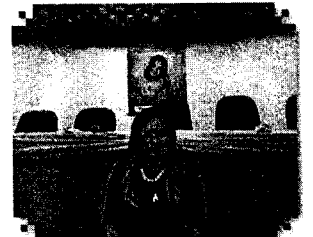
Rebeca Cutrim do HSLZ