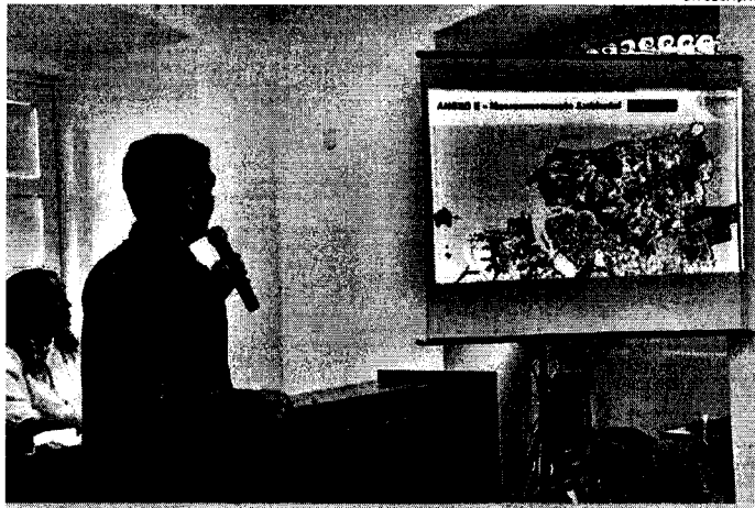
Prefeito Eduardo Braide apresentou o novo Plano Diretor de São Luís, na última terça-feira (5)

As adequações nos mapas da proposta foram feitas pelo Instituto da Cidade, Pesquisa e Planejamento Urbano Rural (Incid). "Prefeitura de São Luís fez uma reanálise de todas as reivindicações feitas pela população durante as audiências públicas. No caso das áreas de risco, elas não faziam parte da proposta anterior; por isso, elaboramos mapas específicos que vão facilitar muito as ações do