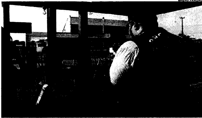
Procon investiga se aumento do preço da gasolina anunciado nos postos é abusivo