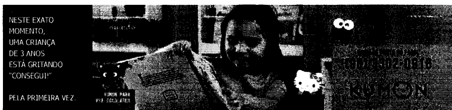
NESTE EXATO MOMENTO, UMA CRIANÇA DE 3 ANOS ESTÁ GRITANDO "CONSEGUI!" PELA PRIMEIRA VEZ.